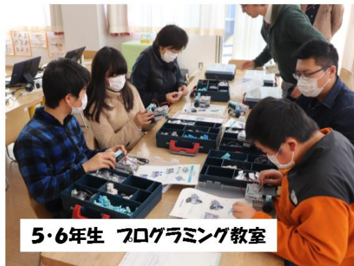
5・6年生 プログラミング教室