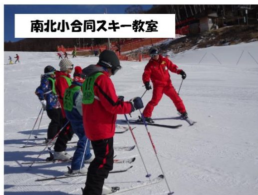
南北小合同スキー教室