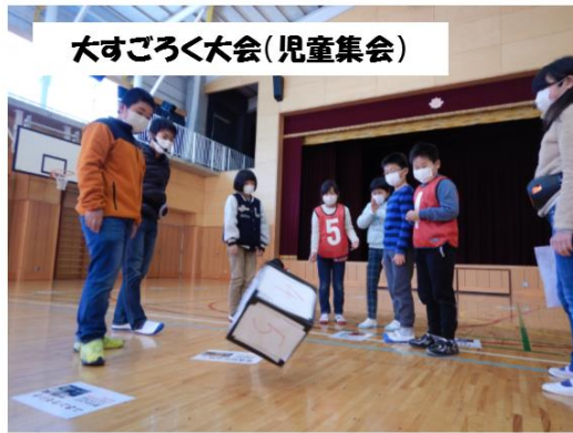
大すごろく大会(児童集会)